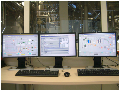
brewmaxx Materialmanagement mit integriertem Report- Designer: Basis für das Berichtswesen mit Chargenrückverfolgung, Mengenzu- und Abgänge und Schwandermittlung.

Damit unterstützt brewmaxx auch traditionelle Vorgehensweisen. Der Prozess muss also nicht auf das Automatisierungssystem angepasst werden, denn brewmaxx passt sich auch mit der Materialwirtschaft an die individuellen Gepflogenheiten jeder Brauerei an. So lässt sich auch dann die Chargenrückverfolgbarkeit durchgängig darstellen, wenn es technisch nicht möglich oder wirtschaftlich nicht sinnvoll ist, eine Vollautomatisierung zu realisieren.